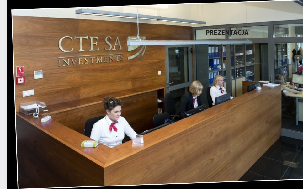
Pracownikom oferuje się indywidualną ścieżkę kariery. Mogą oni liczyć także na różnorodne szkolenia doskonalące ich kompetencje.

to jeden z największych atutów spółki, przekładający się na jej znakomitą opinię na rynku (co, zwłaszcza w branży doradczej, jest wartością nie do przecenienia). Cel jest dla spółki równie ważny jak środki do niego prowadzące. Ta filozofia oznacza